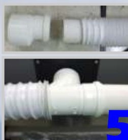
Conecte o tubo flexível