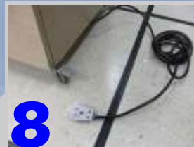
Coloque o purificador no local onde deverá ficar em definitivo, abaixe as travas das duas rodinhas dianteiras, ligue o plug do cabo em 220V e ligue a chave geral ao iniciar qualquer tipo de impressão