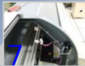
Conecte a outra ponta do tubo flexível nas conexões e no purificador