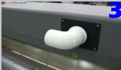
Em seguida, fixe o cotovelo em forma de "L" no furo da direita do equipamento com a utilização dos 4 parafusos originais