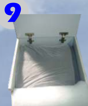
Para substituir o elemento filtrante, basta levantar a levantar a tampa superior