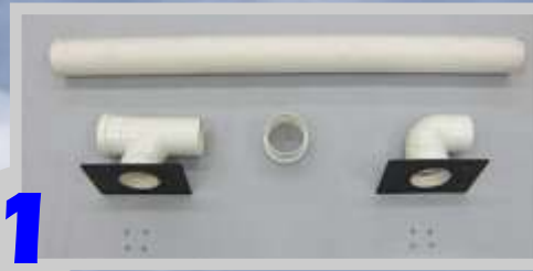
Peças que compõem o conjunto do purificador