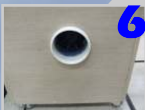
Conecte a outra ponta do tubo flexível nas conexões e no purificador